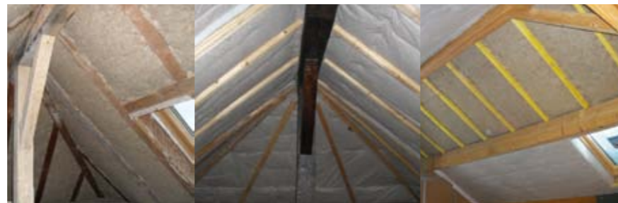
Valnat Premium entre chevrons + TechTOIT®

« C'est une technique innovante afin de répondre aux normes à venir. Le concept d'isolation GPE, associé à un isolant épais posé entre chevrons (laine végétale Valnat) et à un réflecteur multicouches (TechTOIT) afin d'obtenir des coefficients d'isolation très importants et une étanchéité à l'air optimale. Avec cette technique en combles, moins d'épaisseur signifie gain de m 2 pour nos clients. En plus, elle permet aussi de conserver les pannes apparentes. En été, on évite la surchauffe sous les combles et en hiver, le volume est rapidement et durablement chauffé. Sur chaque chantier on ressent un effet feutré, doux et agréable, tant pour l'isolation thermique qu'acoustique. »